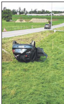
Les fuyards, qui ont franchi plusieurs barrages, ont fini sur le toit. STÉPHANE SANCHEZ

A Romont, l'automobile a quitté la route dans une courbe à gauche et a terminé son embarquée dans un fossé et sur le toit, à proximité de la zone industrielle En Raboud. Le passager – un ressortissant portugais de 45 ans – a pris la fuite à pied avant d'être rapidement maîtrisé par les agents. Le conducteur – un ressortissant